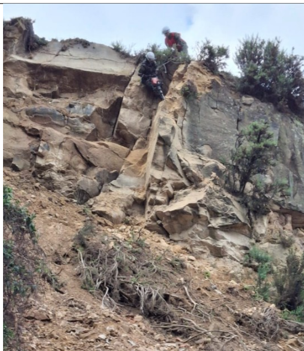
Remoción controlada de bloques con martillo rotopercursor