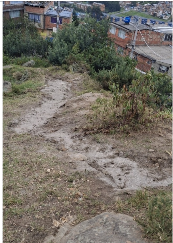
Sellado de grieta

Te invitamos a hacer uso del formulario de Radicación Web