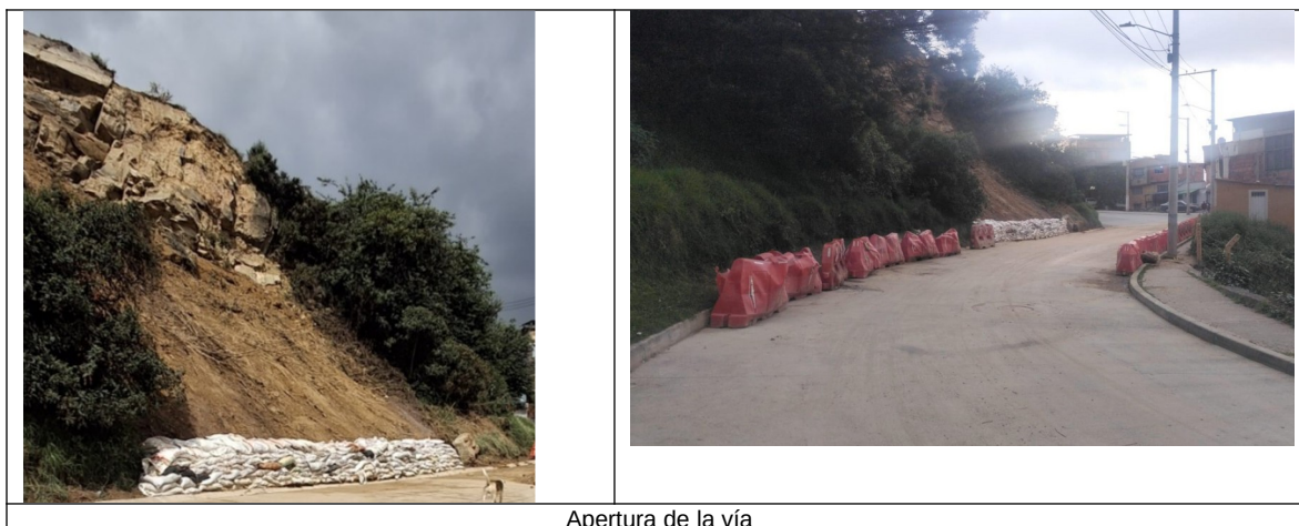
Apertura de la vía

A continuación, se muestra una imagen comparativa antes de la intervención y luego de esta, en donde se aprecia la remoción del material rocoso suelto de la parte superior del talud que corresponde a una arenisca con alto grado de fracturación y el perfilado y remoción del material suelto que se encontraba en la parte media y baja del talud correspondiente a la zona de arcillolita.