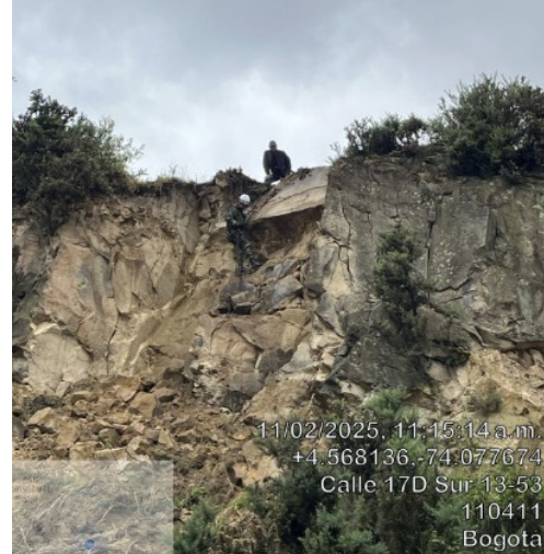
Remoción de bloques iniciando desde la parte superior