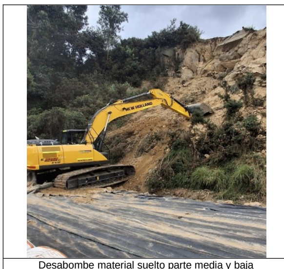
Desabombe material suelto parte media y baja

Por medio de la retroexcavadora del IDIGER en comodato de la UMV, se realizó la descarga del material suelto de la parte media y baja del talud